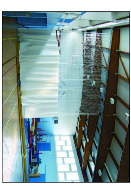
Kolora gotowca hali sportowa, Wzrostla Budowa 2009r/12

LEGENDA: □ ŚCIANY ISTNIEJĄCE □ ŚCIANY NOWOPROJEKTOWANE I MUROWANE (SK ▨ WYBRZEŻENIA