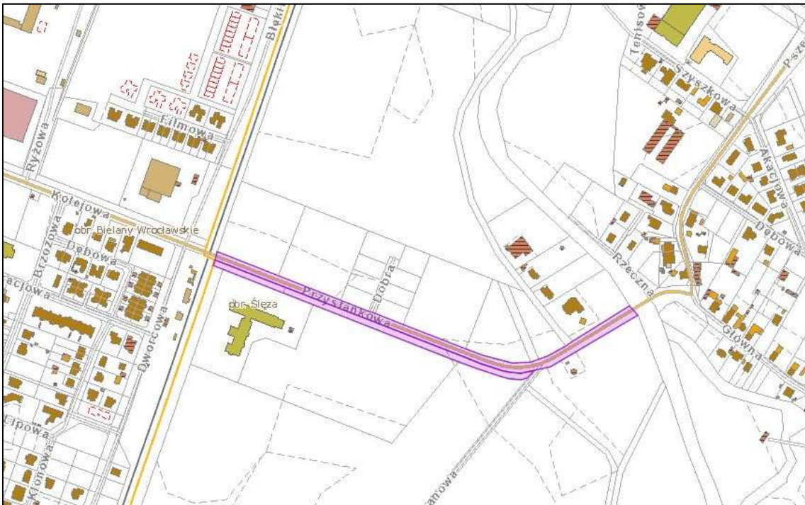
ODCINEK DROGI POWIATOWEJ NR 1951D – BIELANY WROCŁAWSKIE-ŚLEZA