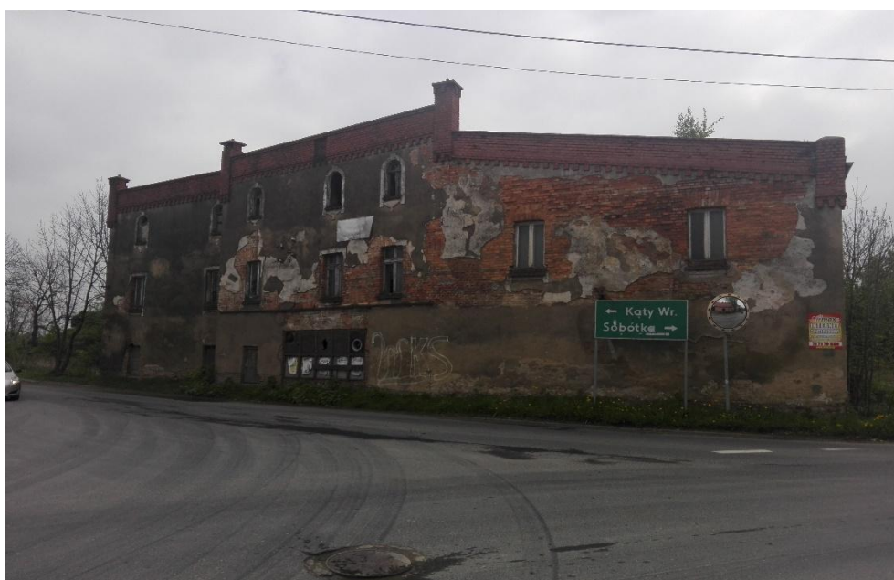
Fot 1 . - Widok od strony skrzyżowania