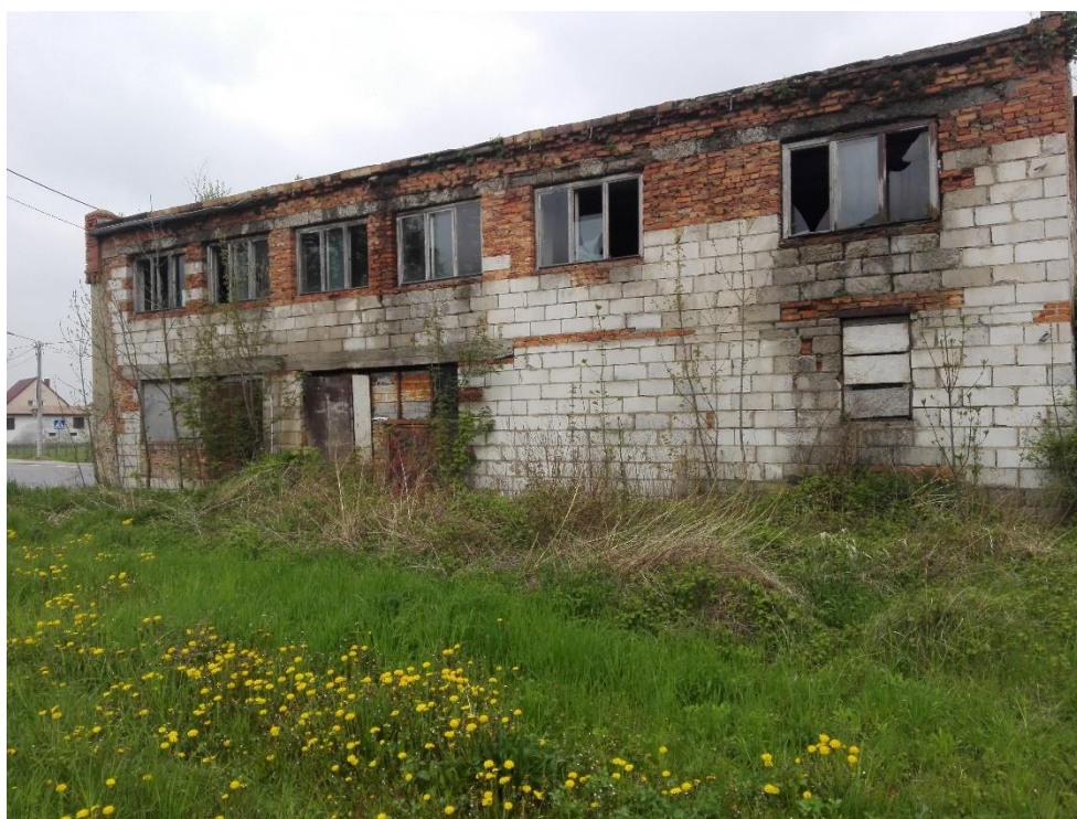
Fot. 2 – Widok jednej ze ścian szczytowych