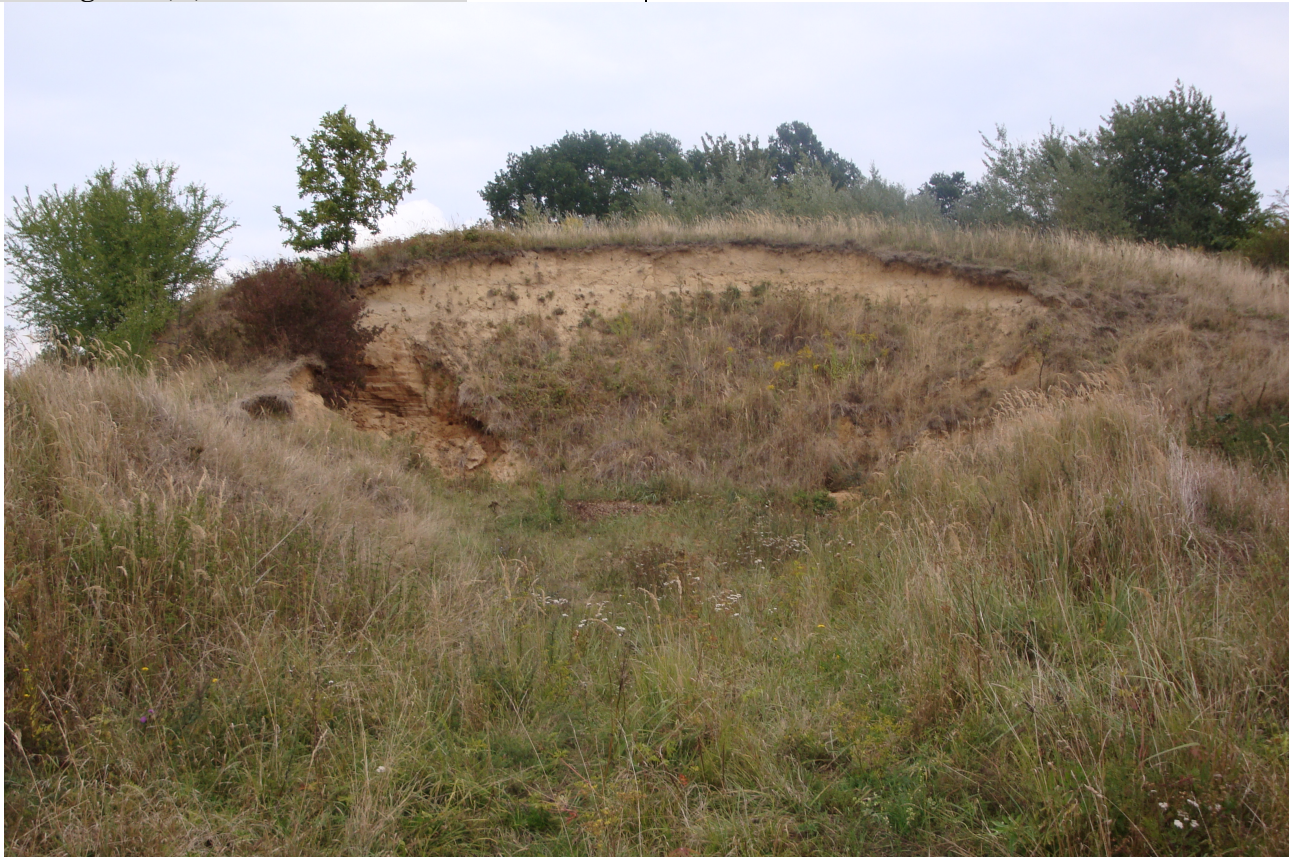
Widok ogólny od S.