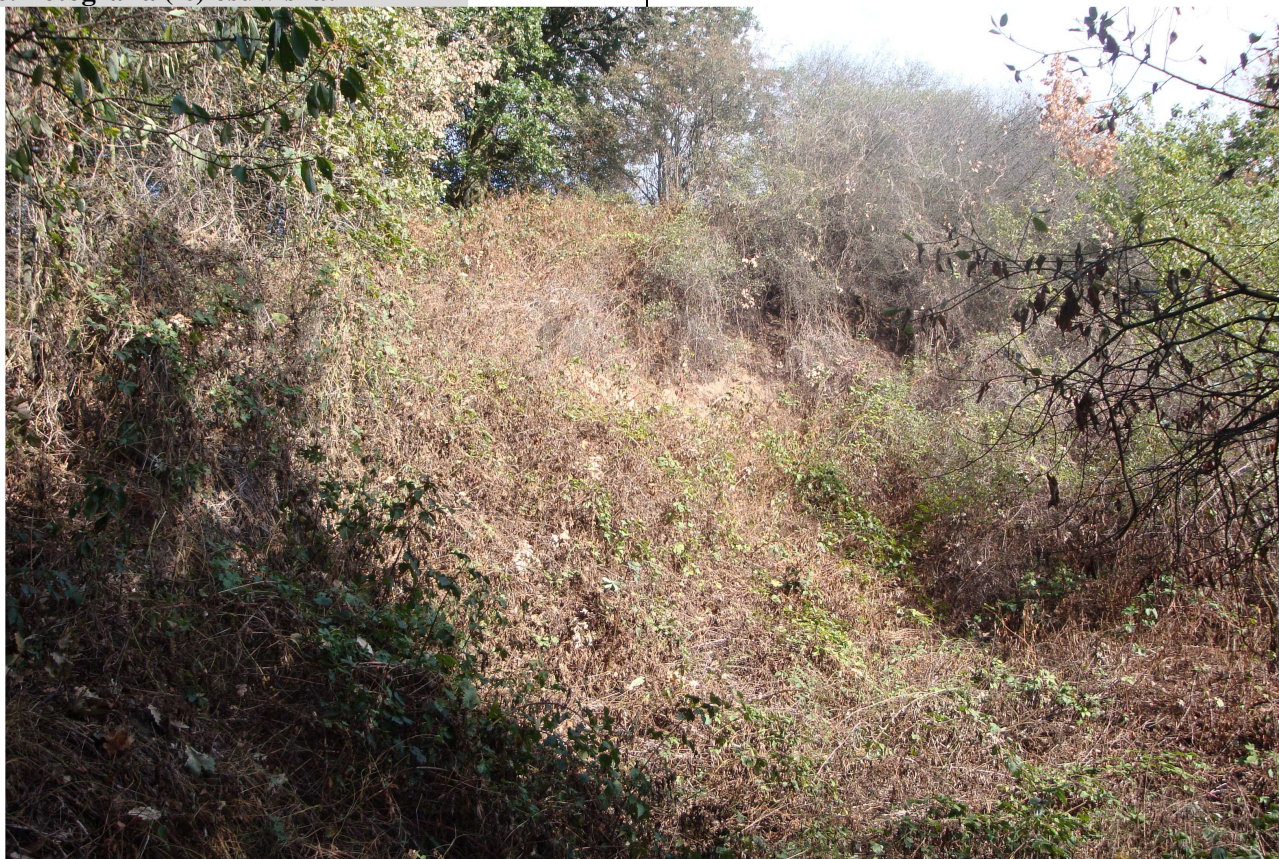
Widok od W na zakrzaczoną skarpe końcową i koluwia.