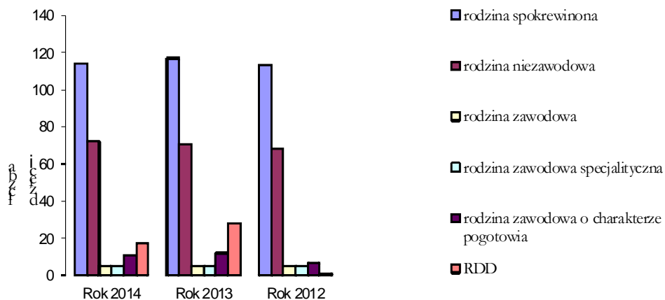
Wykres nr 2.