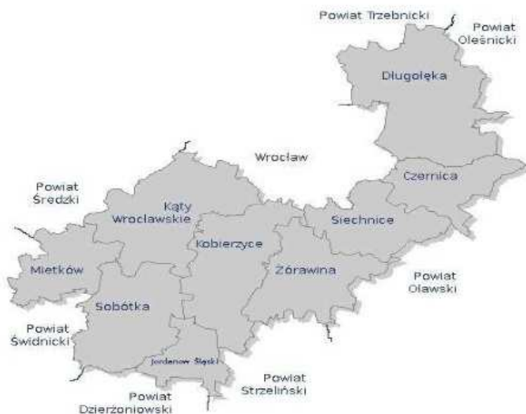
Rys. 1. Mapa Powiatu Wrocławskiego